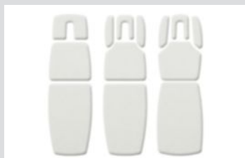
Варианты формы ложа