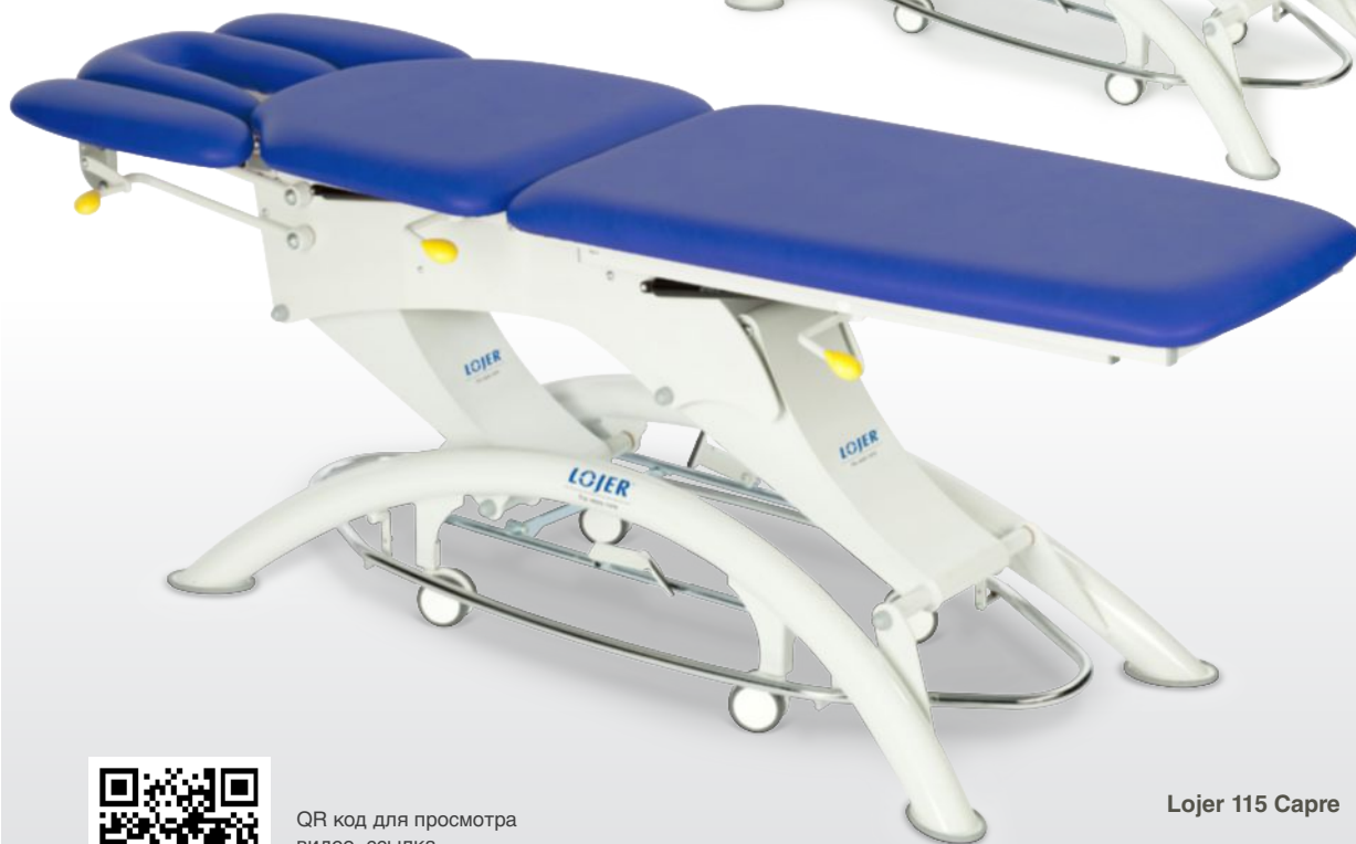
Lojer 115 Capre