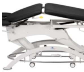
Позиция дренаж (пневмопривод или электропривод)