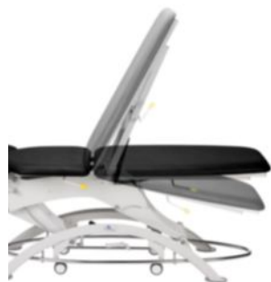
Lojer 110/115 регулируемая ножная секция