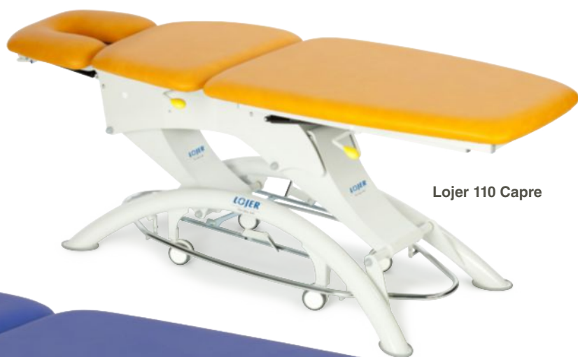
Lojer 110 Capre

Стол series Capre – несомненные лидеры на рынке. Великолепный дизайн и безопасность