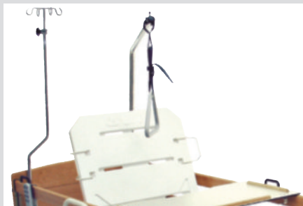
Дуга для активации пациента, инфузионная стойка, изогнутая