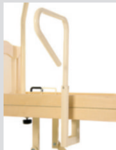
Упор для пациента